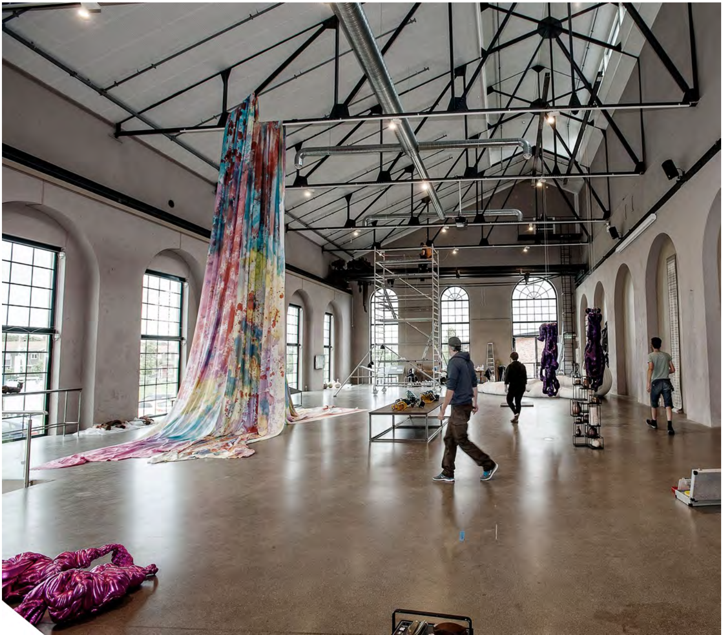
Fra monterings av Kunsthandverk 2016 i Hydrogenfabrikken – SKOP Østfold kunstfestival.