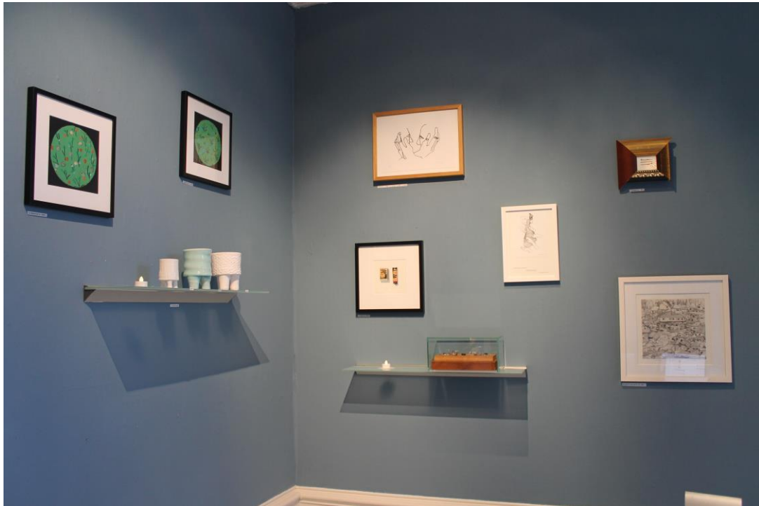
2018 Kunstbutikken Østfold kunstsenter