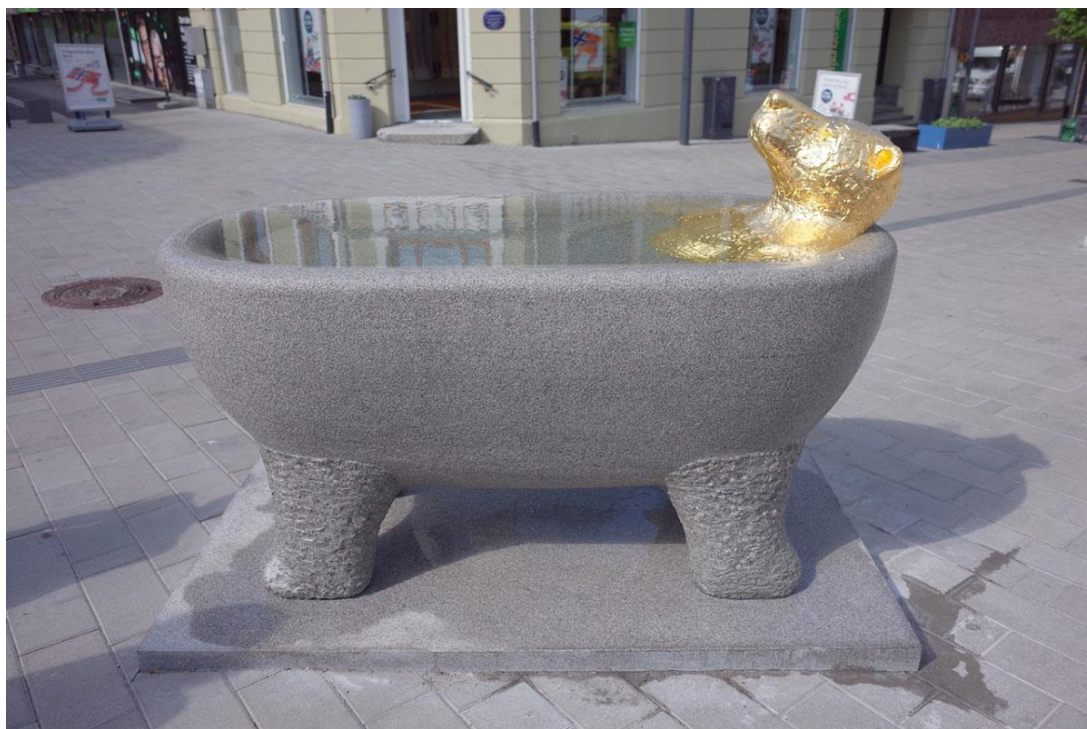
2016 Flod av Petter Hepsø i St.Maries gågate i Sarpsborg

Starte arbeidet med en ny tilnærming til publikum med utgangspunkt i kjente og ukjente materialer og håndverksteknikker.