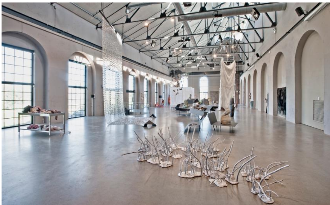
2018 Årsutstillingen, Nasjonal utstilling med materialbasert samtidskunst