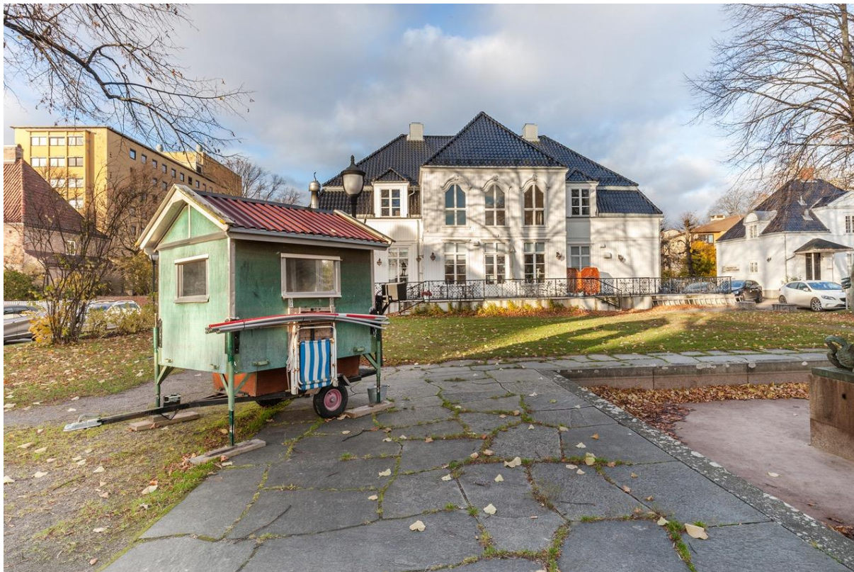
Fwd: FRIHETEN, nå også med vedlegg av Beathe Rønning, Østfold kunstsenter